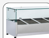
Piano in vetro temperato