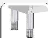
Piedi in acciaio inox regolabili opzionali